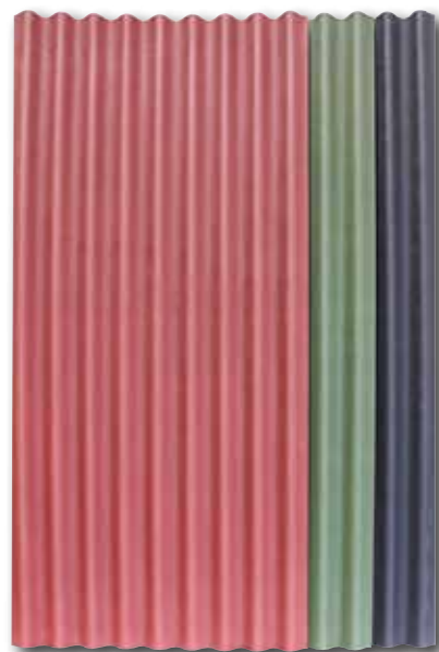
rouge | vert | noir

La face supérieure est revêtue d'un enduit à base de résines acryliques qui augmente la résistance des plaques aux agents atmosphériques et aux rayons U.V.