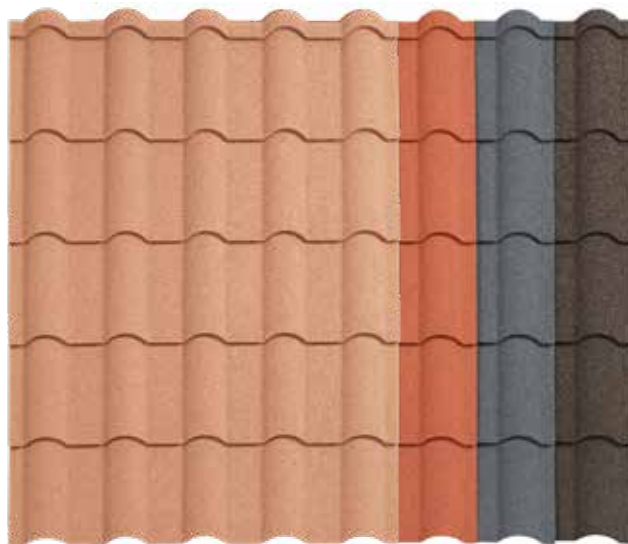
terracotta | rouge | anthracite | marron