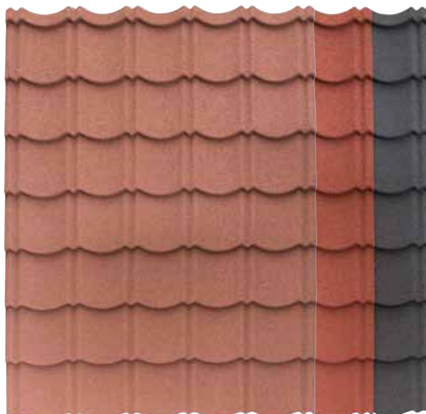
terracotta | rouge | anthracite